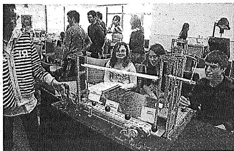
Tecnologia a l'institut. Uns 300 alumnes presenten des d'ahir i fins avui 77 projectes tecnològics al campus de Caupton de la UdL, per on passaran uns 800 estudiants. I.F.