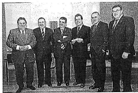
Homenatge als consellers d'Agricultura. El departament d'Agricultura va homenajar ahir els consellers d'Agricultura des de la restauració de la democràcia.